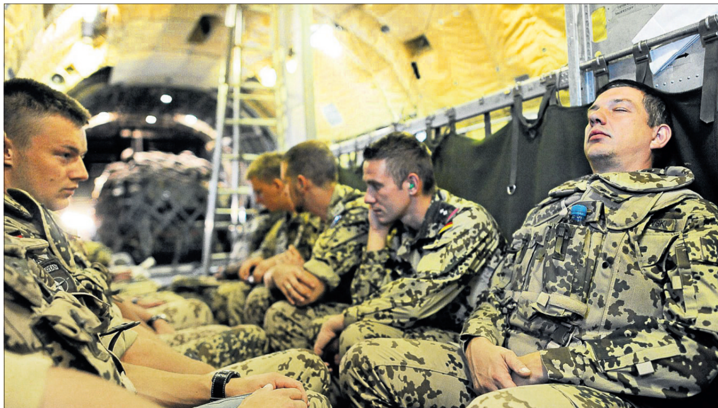
Flug ins Ungewisse: Bundeswehrsoldaten in einer Transportmaschine auf dem Weg nach Kunduz.

Was der Afghanistan-Einsatz die Bundesbürger wirklich kostet, ist schwer zu sagen. Glaubt man den Zahlen der Bundesregierung, kostet die militärische Präsenz der Deutschen am Hindukusch knapp eine Milliarde Euro pro Jahr. Wirtschaftsexperten kommen auf viel größere Summen: Das Deutsche Institut für Wirtschaftsforschung (DIW) geht von bis zu drei Milliarden Euro jährlich aus. 18 bis 33 Milliarden sind bisher in den Einsatz der Bundeswehr geflossen – schätzt das DIW. Es hat allerdings Kosten für Entwicklungshilfe und Folgekosten durch verletzte oder gefallene Soldaten mit eingerechnet. Der Einsatz sollte insgesamt eigentlich nur rund fünf Milliarden Euro kosten, so die Vorstellung der Bundesregierung vor zehn Jahren. Mit den Jahren wurde die militärische Präsenz aber immer teurer und teurer. DK