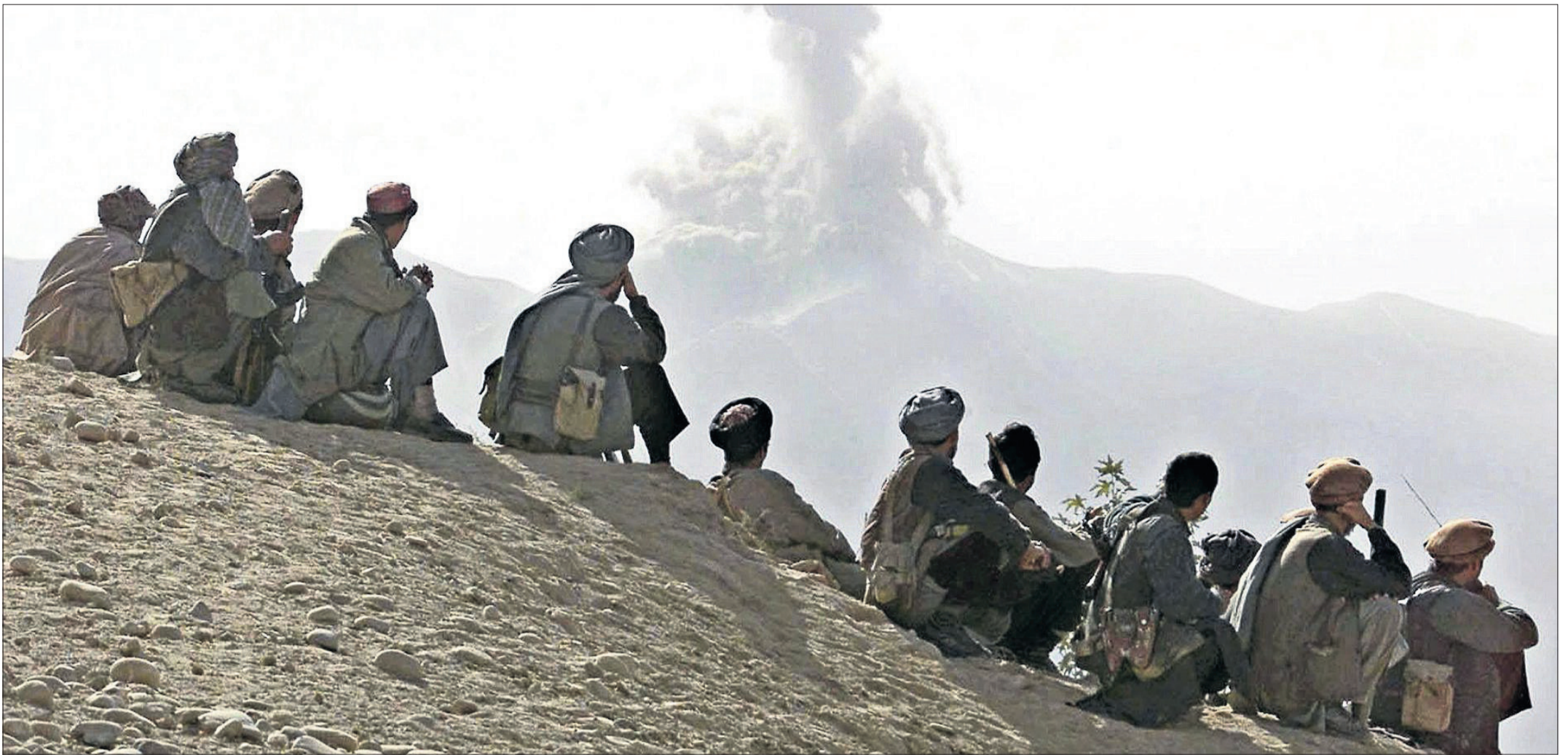
Kriegsalltag: Afghanische Kämpfer beobachten Bombeneinschläge nach einem amerikanischen Luftangriff.